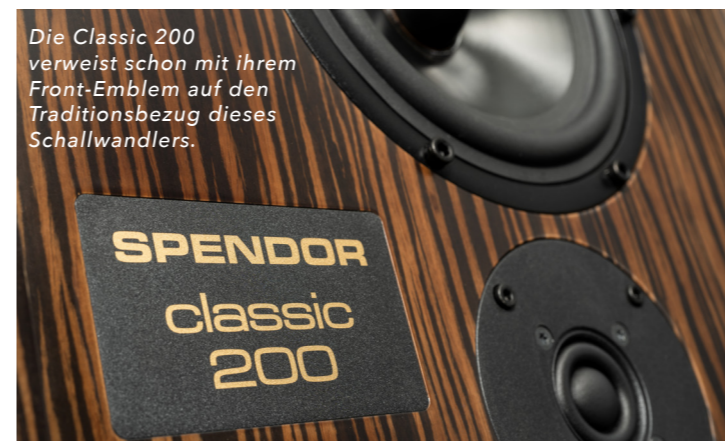
Die Classic 200 verweist schon mit ihrem Front-Emblem auf den Traditionsbezug dieses Schallwandlers.

Mit dem Einstieg des Basses erleben wir dann wieder jenen Energieschub, der uns schon vorhin beeindruckt hat. Mit derartigem Volumen haben wir den Viersaiter noch nicht gehört, und dabei wirkt er keinesfalls überbetont oder aufdringlich, sondern einfach nur unendlich stark. So