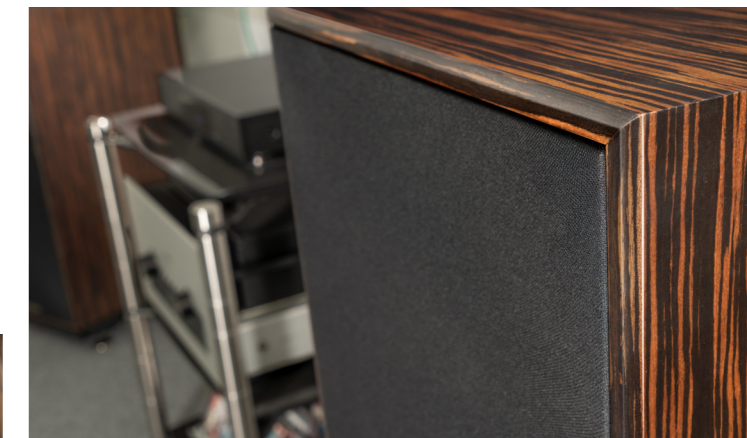
Die Spondor Classic 200 macht auch mit Abdeckungen einen höchstwertigen Eindruck. Die Blenden werden magnetisch gehalten, dadurch bleibt die Front frei von Halterungen oder Aufnahmen.