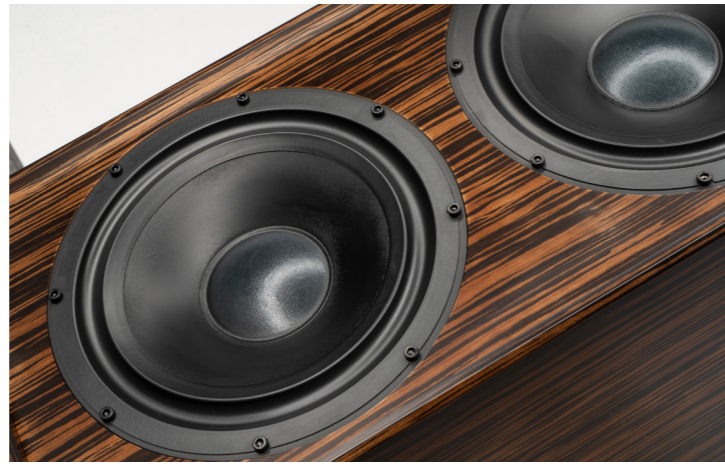
Gleich zwei 30-Zentimeter-Woofers bieten reichlich Membranfläche für die Basswiedergabe. Zusammen mit dem großen Gehäusvolumen erreicht die Classic 200 deshalb einen Tiefton bis runter zu 20 Hertz.

vibrationen zu verhindern, dabei verschiebt man jedoch erst einmal die Resonanzfrequenz nach oben – in jenen Bereich, in dem das Ohr besonders sensibel reagiert. BBC-Boxen wurden hingegen eher dünnwandig gebaut, um diese Resonanzen im weniger hörkritischen tieferen Frequenzareal zu halten. Den Vibrationen wurde dann mit viel Dämm-Material begegnet. Diese Methode hat Spondor nun durch moderne Materialien und ihre gezieltere und ausgeklügeltere Platzierung im Gehäuse hin zu einem dynamischen Dämpfungssystem optimiert, das in den Höhen und Mitten gar nicht resoniert, bei den tieferen Frequenzen hingegen in Abstimmung mit den Woofern schwingt. Wer an die Classic 200 klopft, wird deshalb von dem ungewohnten und sich stellenweise ändernden Korpusklang überrascht sein. Beim Musikhören soll diese Abstimmung jene Wärme und jenen Charme bieten, der zu einem fesselnden Klangerlebnis führt.