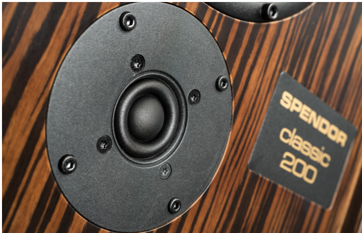
Die Seidenkalotte mit der prägnanten Sicke sorgt für den agilen Hochton.